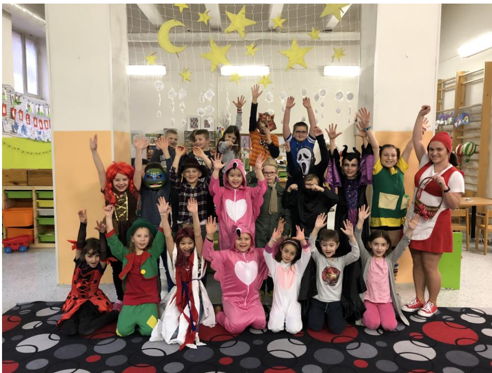
Obrázek 1 Karneval ve školní družině